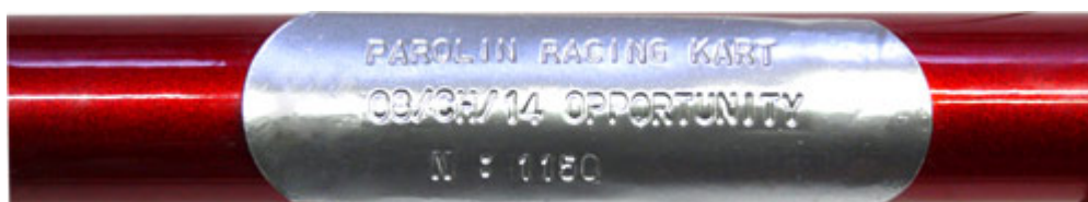
Foto della placchetta che evidenzia il n° di omologa, il nome del modello e il n° del telaio, la stessa dovrà essere fissata nella traversa posteriore B5 verso il centro del tubo stesso.