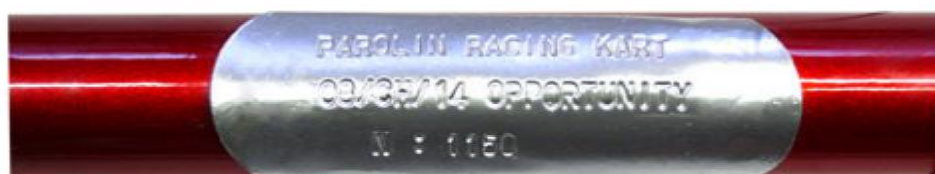
Foto della placchetta che evidenzia il n° di omologa, il nome del modello e il n° del telaio, la stessa dovrà essere fissata nella traversa posteriore B5 verso il centro del tubo stesso.