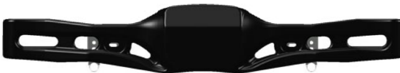
FOTO DEL PARTICOLARE VISTA POSTERIORE